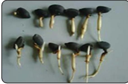
Gambar 3. Kecambah Biji Aren