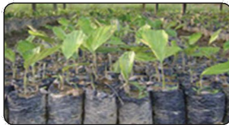
Gambar 4. Benih Aren dalam Polibeg

Kecambah aren yang telah mencapai tinggi 3 s.d 5 cm dipindahkan ke dalam polibeg berukuran 15 cm x 20 cm. Tanah subur ( top soil ) yang digunakan dicampur dengan pupuk kandang dengan perbandingan 2:1, dan diisi \frac{3}{4} bagian kantong polibeg. Benih yang telah ditanam memerlukan penyiraman dan naungan agar terhindar dari cahaya matahari secara langsung. Pemupukan selama pembibitan dalam polibeg menggunakan Pupuk Organik Cair (POC) dengan dosis sesuai pada kemasan dan/atau rekomendasi.