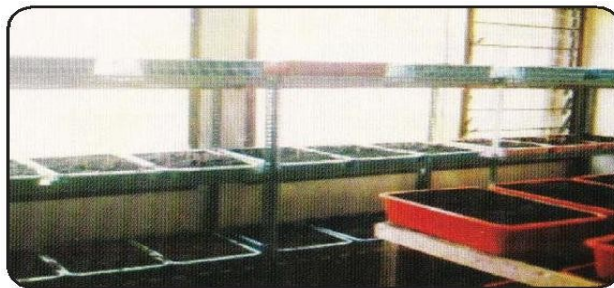
Gambar 2. Persemaian benih

Benih disemaikan pada wadah perkecambahan dengan media sekam padi yang dibakar atau tanah dan pasir dengan perbandingan 1:1. Wadah perkecambahan harus diletakkan pada tempat yang teduh (tidak terkena sinar matahari secara langsung). Biji aren cepat berkecambah jika kondisinya teduh dan lembab.