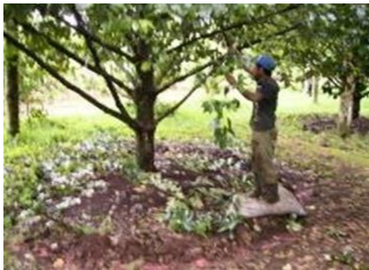
Gambar 11. Pemangkasan Tanaman Pala

Pemangkasan dilakukan sesuai kebutuhan, pada saat cabang yang menjuntai ke bawah menyentuh permukaan tanah, seperti pada gambar 10. Sebaiknya cabang pertama pala dimulai pada ketinggian 1-1,50 m dari permukaan tanah, sehingga cabang dibawah ketinggian tersebut dipangkas. Selain itu cabang wiwilan perlu dibuang.