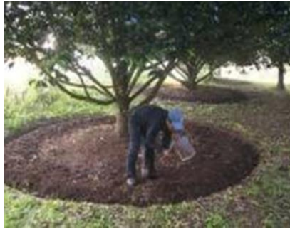
Gambar 9. Pemupukan pada tanaman Pala