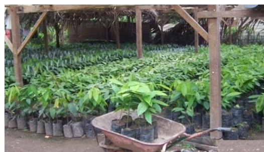
Gambar 2. Persemaian Benih di Polibeg