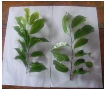
Gambar 3. Bahan entres yang digunakan dalam sambung pucuk