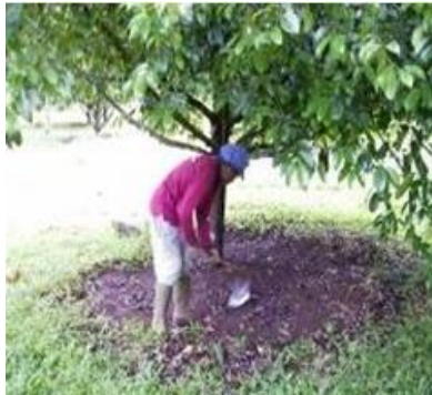
Gambar 8. Penyiangan pohon pala

Penyiangan dilakukan sekurang-kurangnya 2 kali per tahun, selebihnya sesuai keadaan rumput. Pada saat tanaman muda sampai umur 5-6 tahun utamakan penyiangan disekitar pohon atau disebut bobokor. Pemberian mulsa yang berasal dari serasah dedaunan atau sampah yang tidak berbahaya dilakukan setelah peyiangan, penggemburan dan pemupukan disekitar bobokor seperti pada gambar 8.