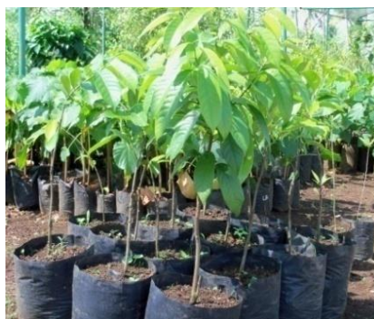
Gambar 5. Benih Pala siap salur