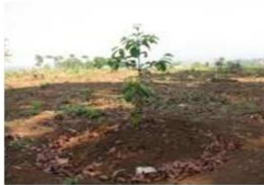
Gambar 7. Tanaman Pala yang baru ditanam