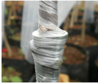
Gambar 4. Sambungan/Grafting