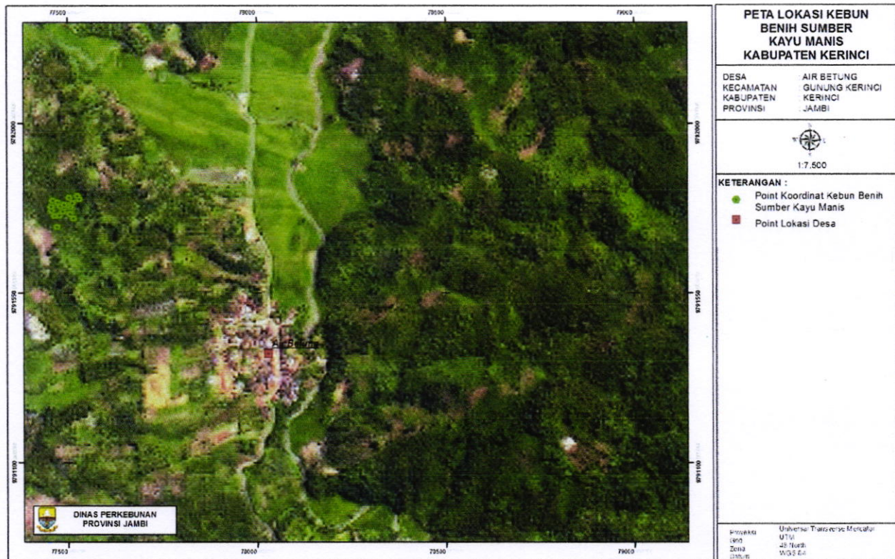
Gambar 1. Peta Lokasi Kayu Manis di Desa Air Betung